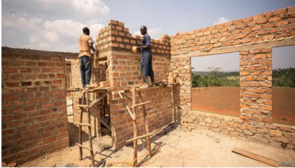
One brick at a time